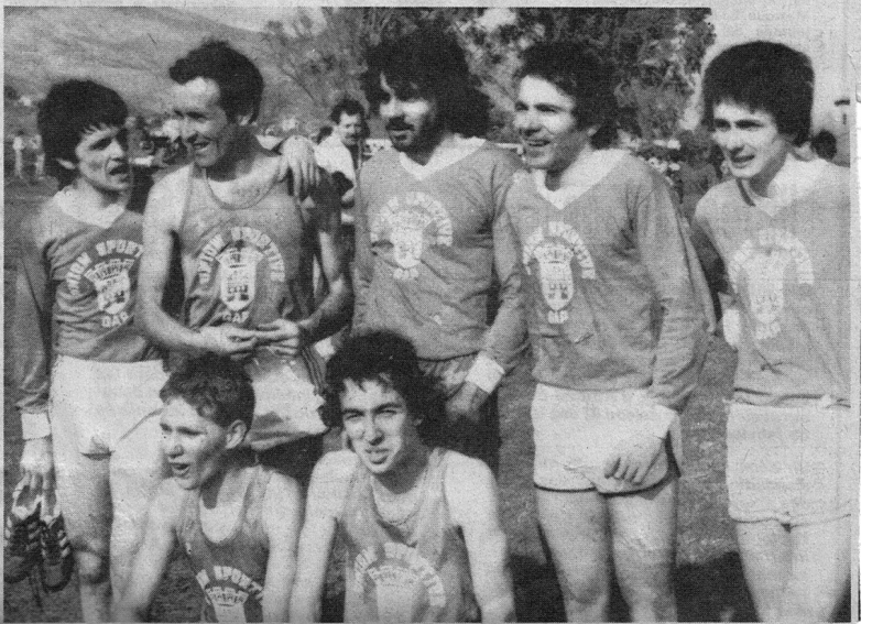
Les seniors de l'U.S. Gap, qui iront au « France », à Chartres.