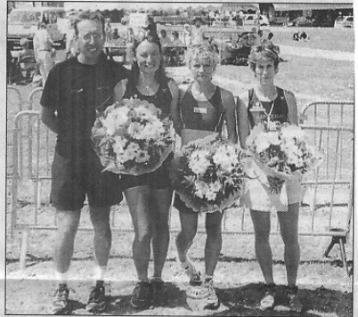
Troisièmes par équipe, les filles de l'ASPTT font la fierté de leur entraîneur.

Chez les hommes, la course fut très rapide, et ce n'était pas leur jour. L'équipe n'a pas démerité, ils se