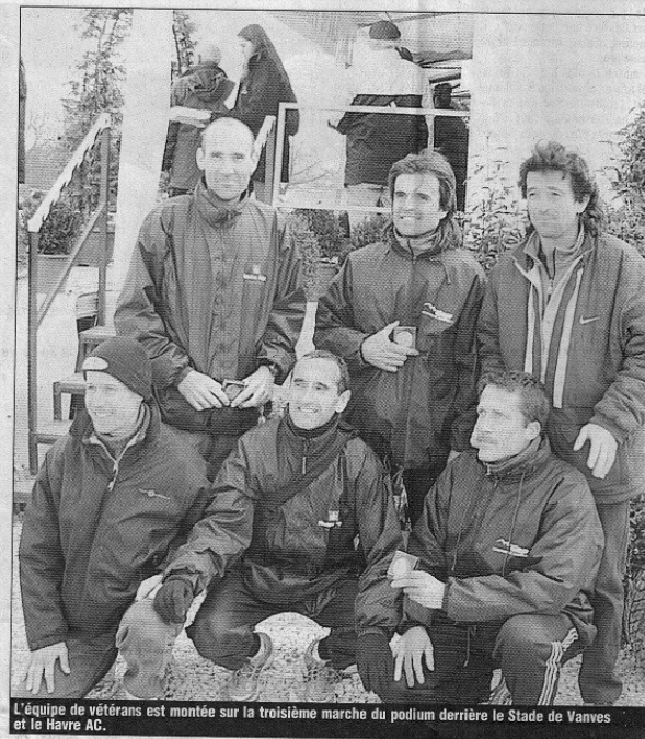
L'équipe de vétérans est montée sur la troisième marche du podium derrière le Stade de Vanves et le Havre AC.