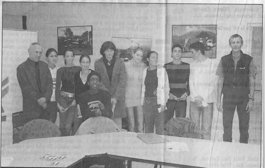
Les lauréats du Trophée Jeune Athlète 2005 ont été récompensés à l'issue de l'assemblée générale.

Si la jeunesse fait l'objet de multiples attentions, qu'en est-il de l'athlétisme d'élite ? Que les dirigeants qui n'apprécient pas de disposer dans son club d'une vitrine de champions lèvent le doigt ? L'athlétisme 05 a prouvé à maintes reprises qu'il était capable de former ses champions, sans chercher à profiter de ceux des autres départements. Mais l'air des montagnes ne suffit plus depuis longtemps à assurer la subsistance des athlètes de haut-niveau. Restent deux canaux possibles pour tirer quelque gloire. Celui du jeune athlète talentueux fidèle à son club et à son entraîneur et celui de l'option par équipe. L'un et l'autre ont su être exploités par le milieu athlétique haut-alpin, qui n'avait jamais connu une telle flambée de titres et de remontées dans le gotha des meilleurs clubs hexagonaux.